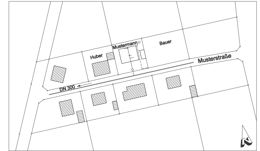
Lageplan M 1:1.000